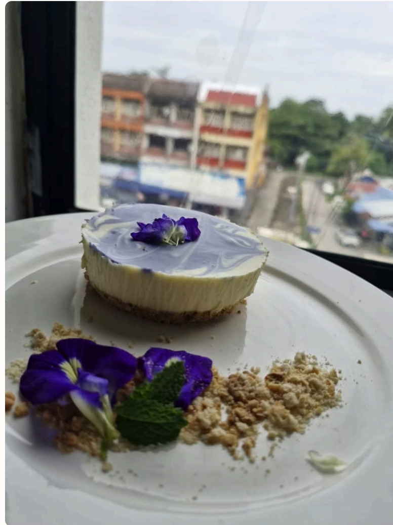
Gambar 4: Kek Keju Bunga Telang