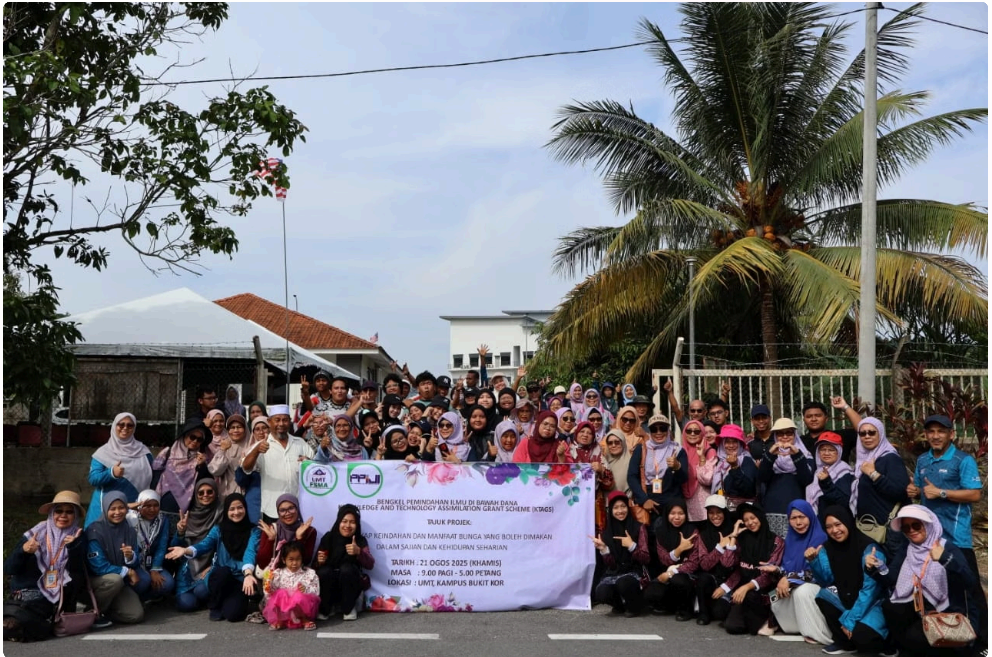
Gambar 1: Peserta-peserta dan Ahli Jawatankuasa Bengkel Menyingkap Keindahan Bunga yang Boleh Dimakan dalam Sajian dan Kehidupan Sehari-hari yang telah diadakan pada 21 Ogos 2025 di Universiti Malaysia Terengganu, Kampus Bukit Kor.