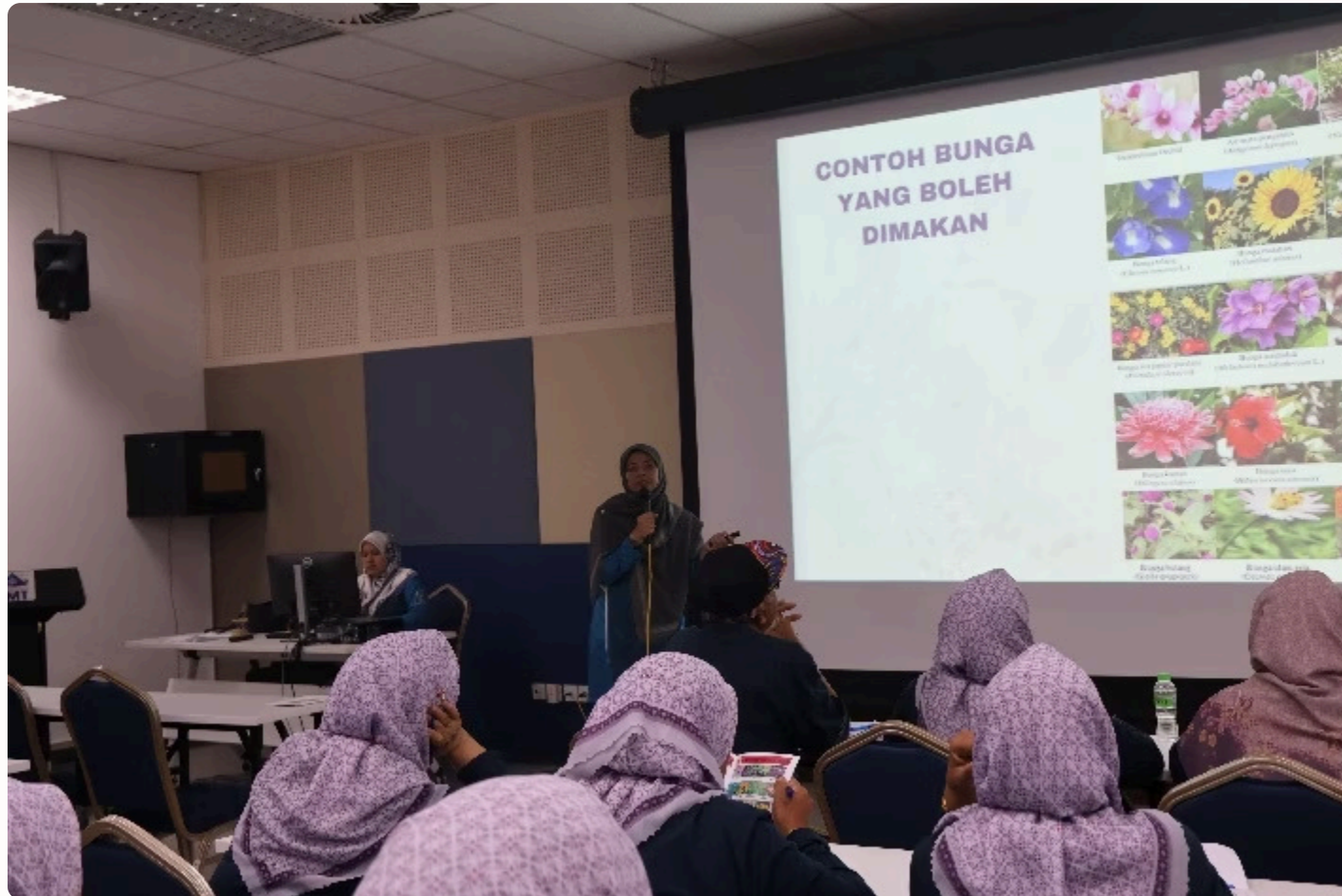
Gambar 2: Sesi ceramah dan bengkel. Peserta berpeluang mempraktikkan sendiri teknik-teknik pengendalian bunga yang boleh dimakan semasa bengkel.